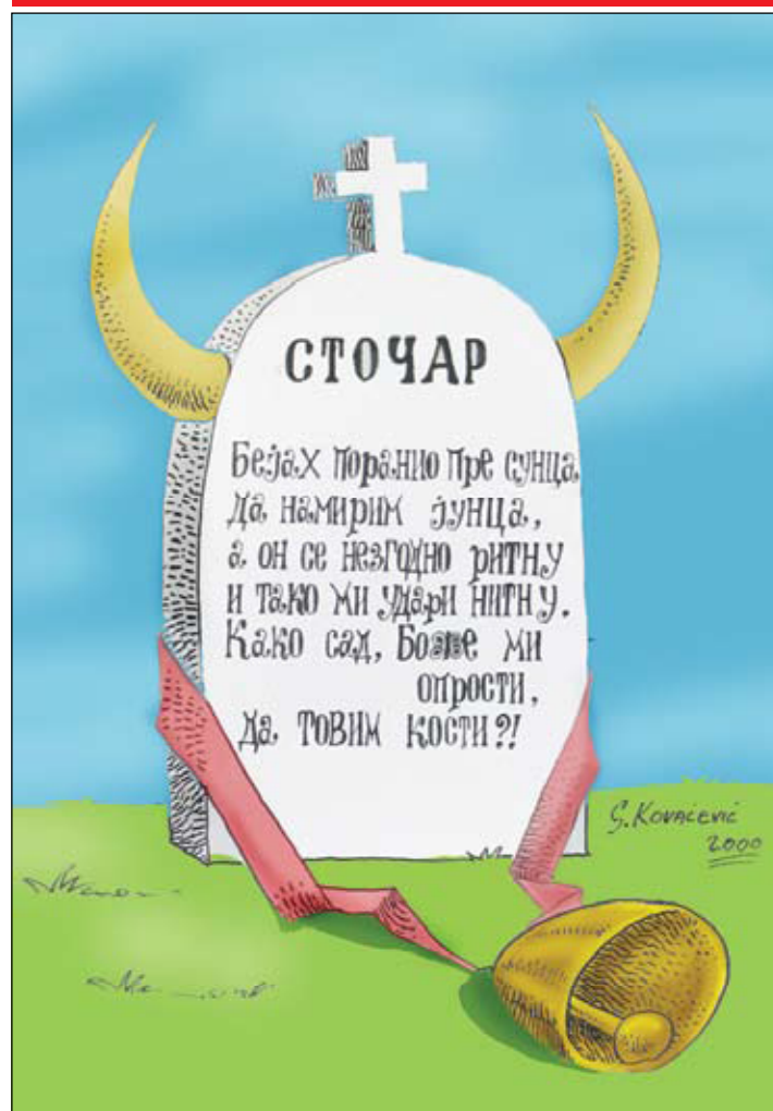
Спомен подиже Димитрије Јовановић и камен изреза Саша Ковачевић