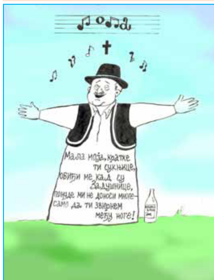
Спомен подиже и камен изреза Драган Бунарџић