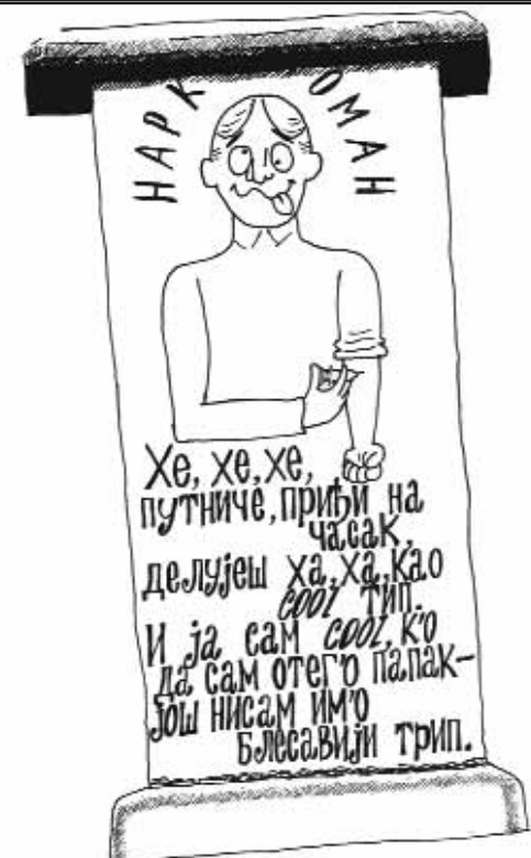
Спомен подиже и камен изреже Драган БУНАРЏИЋ