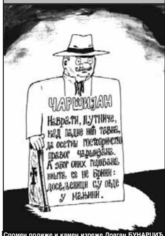
Спомен подиже и камен изреже Драган БУНАРЏИЋ