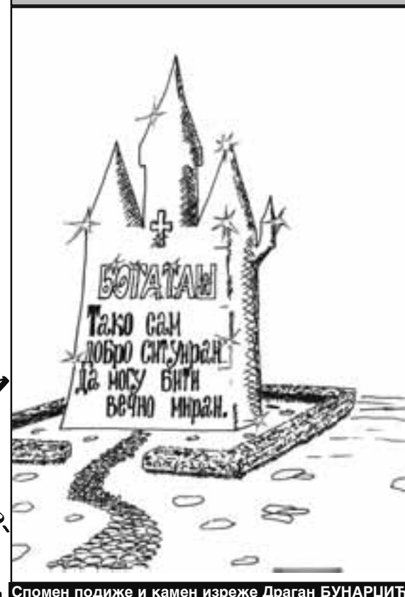
Спомен подиже и камен изреже Драган БУНАРЏИЋ