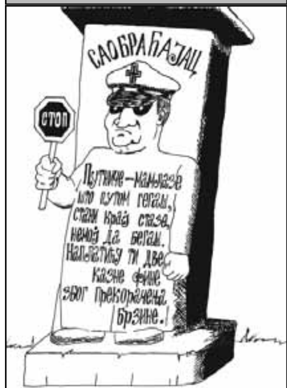
Спомен подиже и камен изреже Драган БУНАРЏИЋ